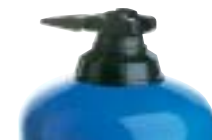
By-Pass intégré : Système de mise en route (on) et d'arrêt (off) de l'aspiration du produit.

Les options permettent d'adapter au mieux le doseur aux besoins. Leur utilité sera déterminée avec l'aide de nos services techniques.